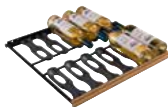
clayettes coulissantes jusqu'à 12 bouteilles