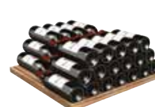
clayettes de stockage jusqu'à 77 bouteilles