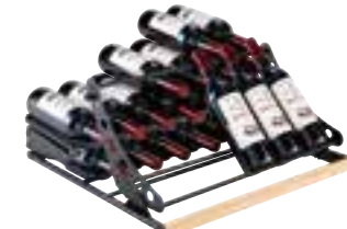
clayettes de présentation jusqu'à 32 bouteilles

L'espace entre les clayettes a été pensé pour protéger les étiquettes de vos bouteilles, particulièrement celles de Champagne.